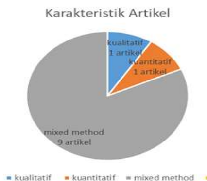
Gambar 2 Karakteristik Artikel Berdasarkan Desain dan Pendekatan Penelitian

Berdasarkan desain dan pendekatan penelitian serta kriteria inklusi terdapat 11 artikel yang sesuai. Terdapat 1 penelitian kualitatif, 1 penelitian mixed method , dan 9 artikel menggunakan metode kuantitatif. Dua artikel diterbitkan dalam jurnal non kesehatan serta tidak ada artikel yang diterbitkan dalam jurnal kebidanan.