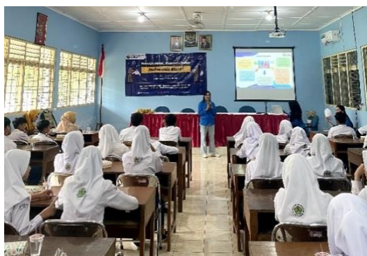
Gambar 2. Presentasi materi.

sebagai sebuah proses pengenalan nilai-nilai yang sedemikian rupa hingga akhirnya terbentuk suatu individu yang utuh. Maka dapat dikatakan seorang individu tidak pernah melakukan sosialisasi dengan sempurna, ia dapat diibaratkan sebagai seorang individu yang tidak utuh. Metode ini dipilih karena memiliki beberapa keunggulan antara lain, memupuk keberanian, memperkaya pengetahuan, serta sikap dan tindakan dalam menghadapi situasi serta meningkatkan antusiasme siswa/i.