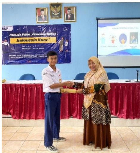
Gambar 3. Pemberian reward

Mengingat manfaat positif dari kegiatan pengabdian Masyarakat ini, maka kegiatan perlu dilakukan dengan sasaran siswa/i OSIS SMP Negeri 2 Swon, dengan harapan para siswa/i ini memiliki pandangan, pengetahuan dan sikap yang baik terhadap kehamilan tidak diinginkan, pernikahan dini, dan perencanaan keluarga. dengan demikian keberlanjutan kegiatan dapat lebih terjamin setelah memiliki persepsi yang sama mengenai bahaya kehamilan tidak diinginkan, pernikahan dini dan perencanaan keluarga.