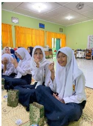
Gambar 1. Pembagian Tablet Tambah Darah

Setelah penyampaian materi, peserta diberikan kesempatan untuk bertanya dan berdiskusi. Pendekatan interaktif ini bertujuan membangun rasa ingin tahu dan kesadaran siswa terhadap pentingnya kesehatan diri sejak usia dini. Kegiatan ditutup dengan penyampaian rangkuman dan penekanan pada pentingnya konsumsi TTD secara rutin.