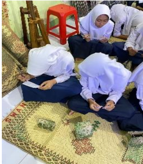
Gambar 2. Pengisian Umpan Balik