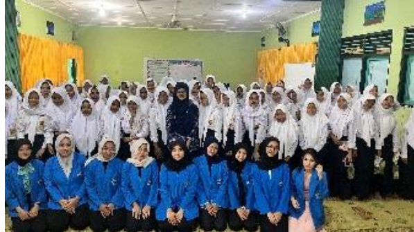
Gambar 3. foto bersama