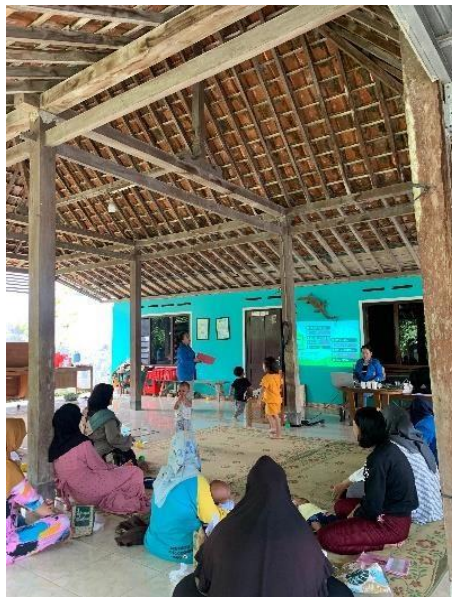
Gambar 1. Gambar pelaksanaan pengabdian

Tahap evaluasi dilakukan melalui analisis perbandingan nilai pretest dan posttest untuk mengukur efektivitas kegiatan. Hasil menunjukkan peningkatan signifikan dalam pemahaman peserta.