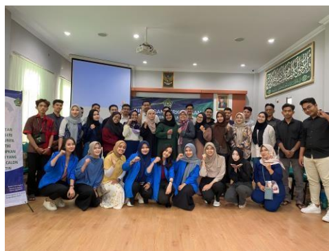
Gambar 2. Para Calon Pengantin

Berdasarkan tabel 1. Dapat disimpulkan bahwa jumlah peserta sebanyak 30 pasang (30 orang) dengan usia dibawah 25 tahun sebanyak 10 orang dan usia diatas 25 tahun sebanyak 20 orang.