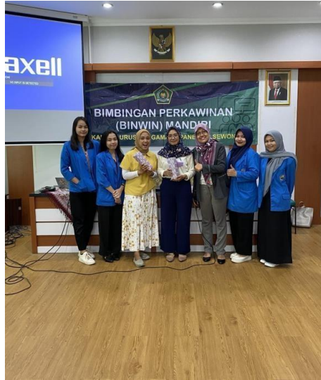
Gambar 3. Pembagian dorprize pada peserta

Ari Andriyani, dkk., upaya promotif kesehatan prakonsepsi untuk mempersiapkan kehamilan yang sehat pada calon pengantin di kantor urusan agama kapanewon sewon, bantul Yogyakarta