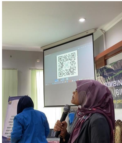
Gambar 2. Pre test dan posttest menggunakan media Quizizz pada calon pengantin.

Berdasarkan tabel 2 terdapat peningkatan pengetahuan signifikan pada calon pengantin setelah di berikan materi kesehatan prakonsepsi dengan media power point. Adapun topik yang disampaikan mengenai: persiapan pranikah, Hak reproduksi dan seksual, pemenuhan gizi prakonsepsi serta tanda kehamilan.