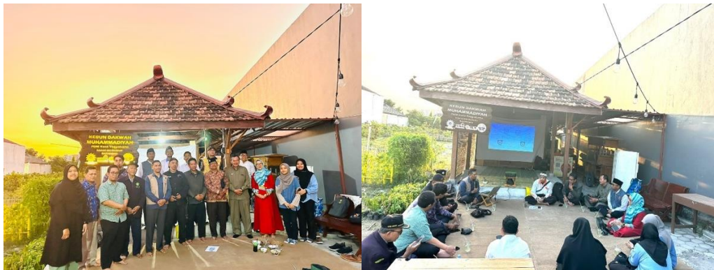
Gambar 5. Koordinasi pelaksanaan eco-masjid/mushola dengan Muhammadiyah

Dilakukan pula tanggal 6 September 2023 yaitu koordinasi pelaksanaan eco-masjid dengan MLH PPM, PWM dan Ortom Muhammadiyah di kebun dakwah Muhammadiyah dengan Gerakan Nyata sodakoh sampah di mushola/masjid, panti asuhan dan sekolah milik Muhammadiyah/'Aisyiyah.