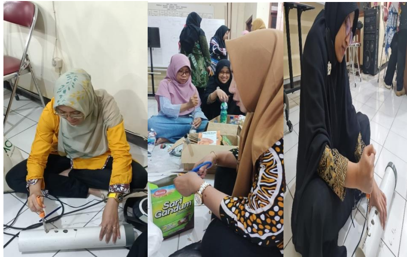
Gambar 4. Pelatihan pembuatan losida untuk pengolahan sampah organik

Dilakukan pula tanggal 6 September 2023 yaitu koordinasi pelaksanaan eco-masjid dengan MLH PPM, PWM dan Ortom Muhammadiyah di kebun dakwah Muhammadiyah dengan Gerakan Nyata sodakoh sampah di mushola/masjid, panti asuhan dan sekolah milik Muhammadiyah/'Aisyiyah.