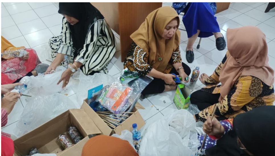
Gambar 3. Pelatihan eco-brick

Di waktu yang sama setelah sosialisasi langsung diberikan materi tentang salah satu bagian dari kegiatan eco-masjid yaitu pengelolaan sampah organik dan anorganik. Pelatihan berupa pelatihan pembuatan losida dan eco-brick.