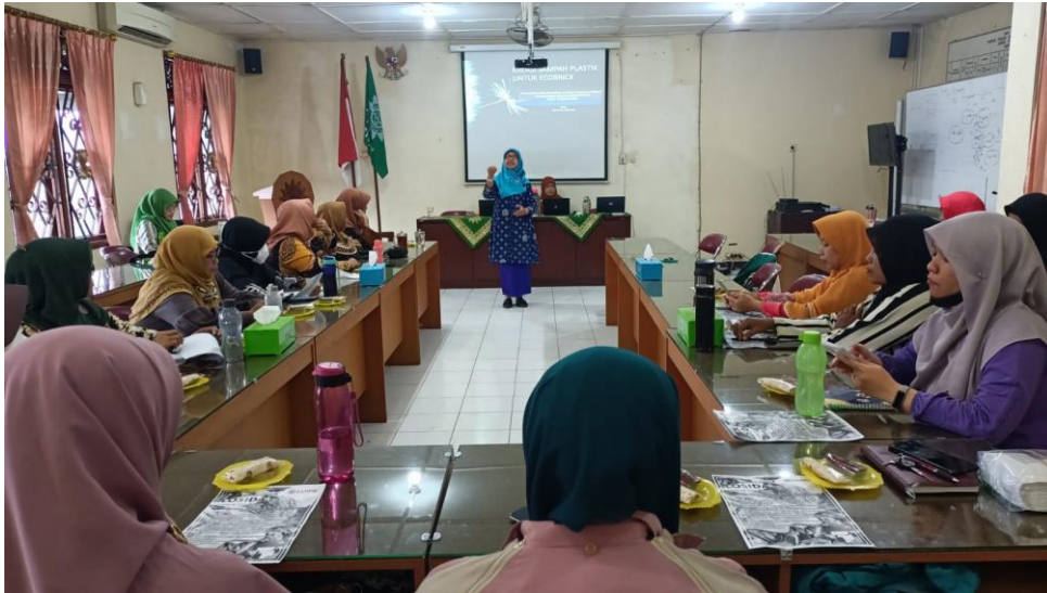
Gambar 2. Dukungan LLHPB DIY untuk pelaksanaan program eco-masjid

Di waktu yang sama setelah sosialisasi langsung diberikan materi tentang salah satu bagian dari kegiatan eco-masjid yaitu pengelolaan sampah organik dan anorganik. Pelatihan berupa pelatihan pembuatan losida dan eco-brick.