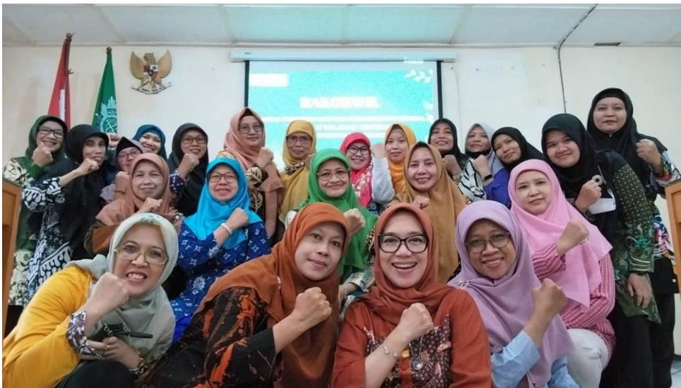
Gambar 1. Sosialisasi dan Penyampian Program Eco-masjid/mushola di Kantor PWA DIY

Koordinasi, sosialisasi dan penyampaian materi eco-masjid/mushola dilaksanakan dengan peserta kegiatan adalah Ketua dan jajaran LLHPB PWA DI. Yogyakarta. Kegiatan ini dilakukan di Kantor PWA DI. Yogyakarta untuk melakukan koordinasi dan sosialisasi kegiatan PKM. Pada kegiatan ini dilakukan paparan terkait kegiatan yang dilaksanakan, peran dan kerjasama antara pengusul dengan mitra. Dilaksanakan di awal kegiatan. Dilaksanakan tanggal 17 Agustus 2023. Sebelumnya telah dilakukan sosialisasi program pada tanggal 29 Juli 2023 secara daring di pertemuan rutin LLHPB PWA DI. Yogyakarta serta strategi pelaksanaan program.